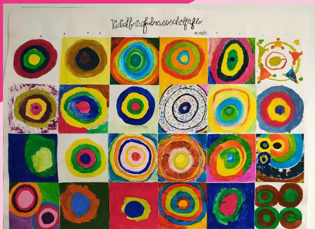
Œuvre inspirée de Kandinsky